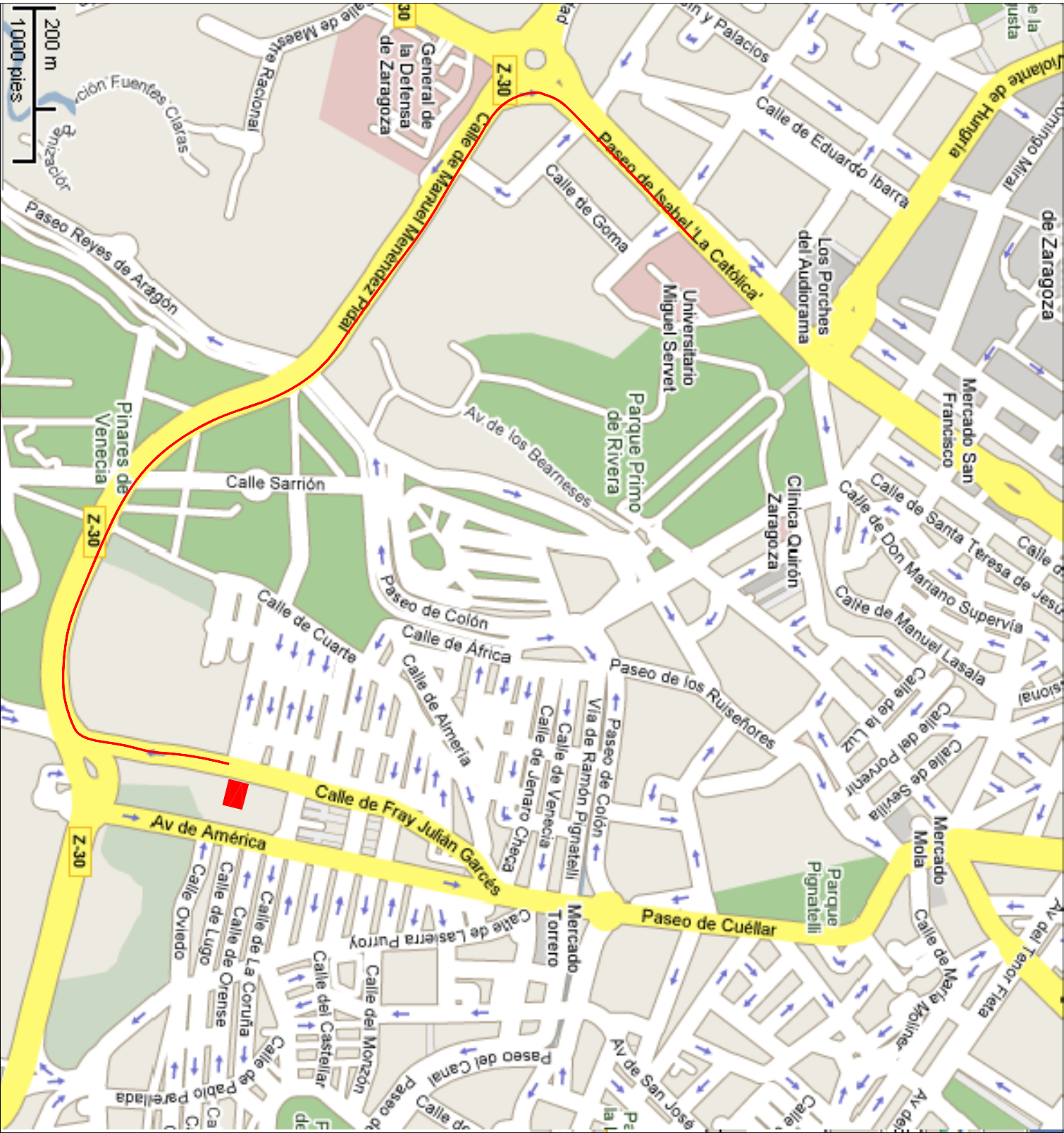
RECORRIDO DE EVACUACIÓN HASTA EL CENTRO SANITARIO